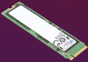
2 TB Performance PCIe Gen 4 NVMe OPAL2 M.2 2280 SSD