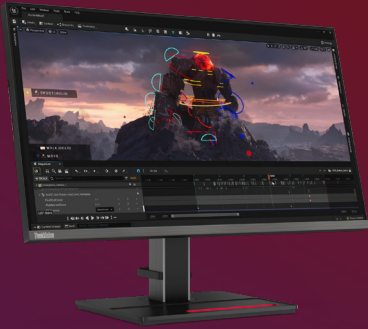
Lenovo ThinkVision P27u-20 68,6 cm (27") 4K-UHD-Monitor