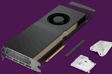
NVIDIA® RTX™ A4500 Grafik